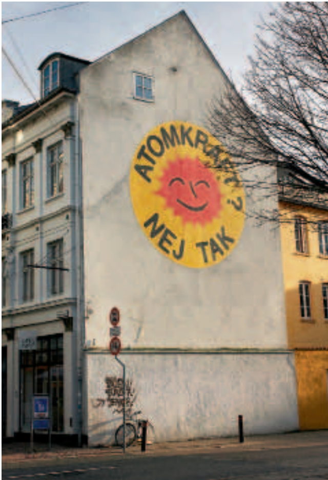
I 1983 blev den smilende sol malet i en flere meter høj ver- sion på gavlveggen ved hjørnet af Emil Vettis Passage og Vester- gade i Aarhus.

Fra i udgangspunktet at være et ydmygt bidrag til en græs- rodsbevægelse har den smilende sol indtaget pladsen som et nationalt klenodie. Denne nye position blev lysende klar, da Nationalmuseet i maj 2000 i anledning af mærkets 25 års jubilæum åbnede en lille udstilling om mærket og dets hi- storie. Året efter blev mærket en del af Nationalmuseets nye permanente udstilling “Danmarkshistorier 1660-2000”. Den